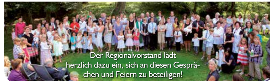
Der Regionalvorstand lädt herzlich dazu ein, sich an diesen Gesprächen und Feiern zu beteiligen!

Es gibt außerdem einen gemeinsamen Gottesdienst, an dem sich alle evangelischen Kirchen der Region beteiligen. Es ist der dritte Taufest-Gottesdienst der Region. Dieser findet open air statt: am Samstag, 18. Juni um 14.00 Uhr im historischen Pfarrgarten in Beber .